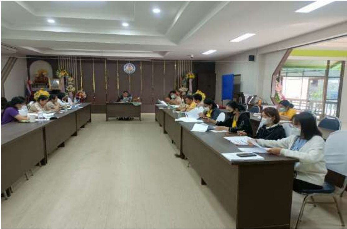
ภาพถ่ายการประชุม วันที่ ๑๐ กุมภาพันธ์ ๒๕๖๖