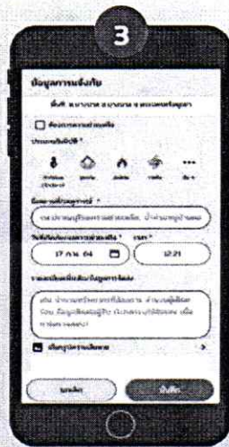
กรอกข้อมูล สาธารณภัยที่เกิดขึ้น และกดบันทึก