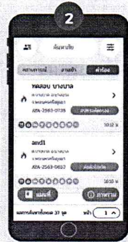
สามารถติดตามสถานะในแถบคำร้อง