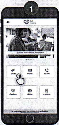
คลิก "แจ้งภัย" เพื่อแจ้งเหตุสาธารณภัย