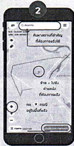
เลือกตำแหน่งที่ต้องการแจ้ง